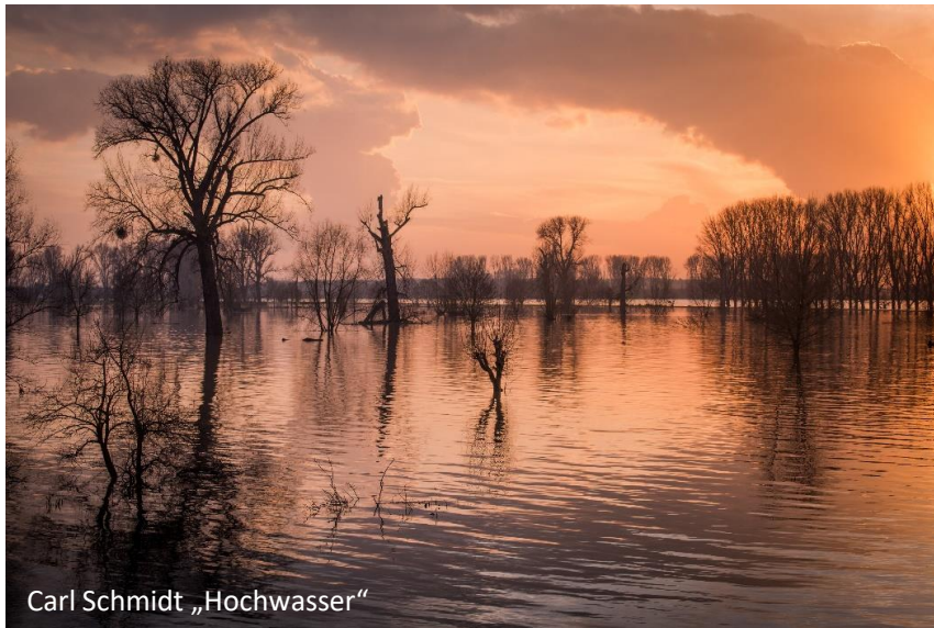
Carl Schmidt „Hochwasser“

„Bäume, Bäche, Betonwüsten – Unsere Natur heute“